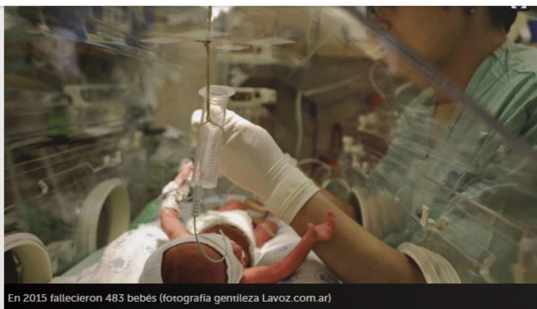
En 2015 fallecieron 483 bebés

Los frutos del esfuerzo del trabajo en equipo e integrado con otros sectores de la sociedad, se ven reflejados en estos números. Nuestro reconocimiento a todos los equipos de salud que trabajan por la salud de los niños.