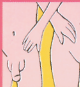
Masturbación y Caricias