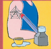
Compartir tintas de tatuaje