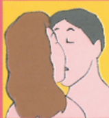
Besos de lengua