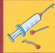
Compartir agujas, jeringas, equipos de inyección