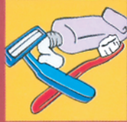
Compartir objetos de uso personal