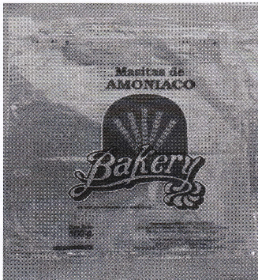
Imagen del producto en infracción