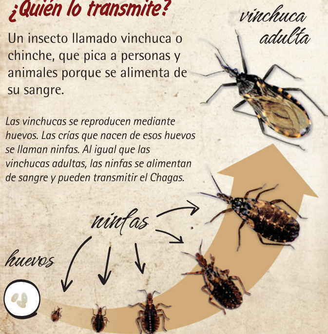
Ciclo de vida de las vinchucas

Las vinchucas se reproducen mediante huevos. Las crías que nacen de esos huevos se llaman ninfas. Al igual que las vinchucas adultas, las ninfas se alimentan de sangre y pueden transmitir el Chagas.