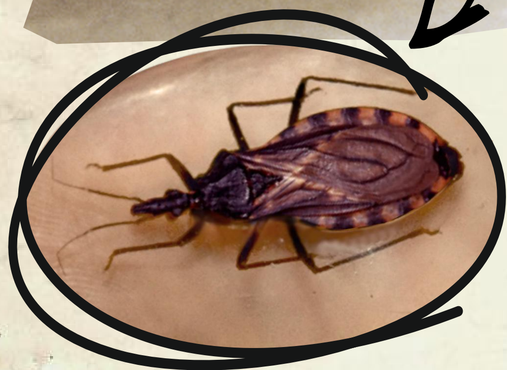
imagen ampliada de la vinchuca