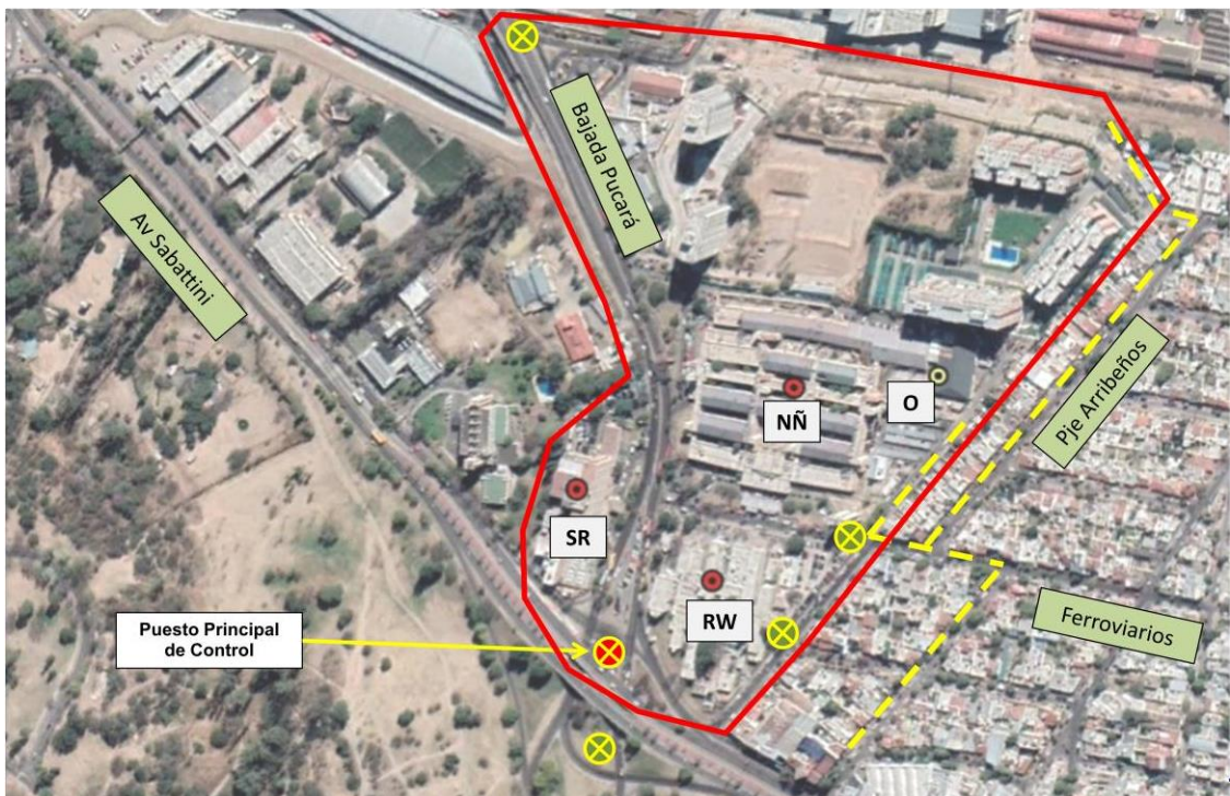
FIGURA Nro 2